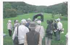
アルテピアッツァ美唄