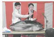
マグロ解体ショー