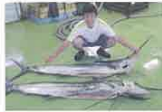
産地直送メニュー