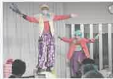
敬老お祝いイベント