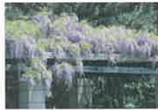
前田森林公園~藤棚