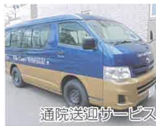
通院送迎サービス