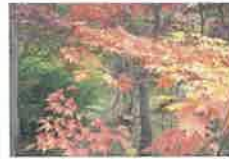
平岡樹芸センター(紅葉)