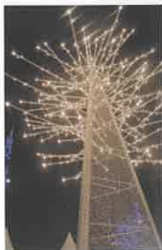
ホワイトイルミネーション