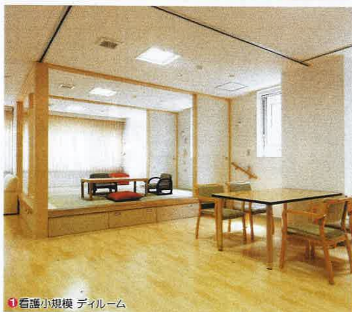
1 看護小規模 デイルーム