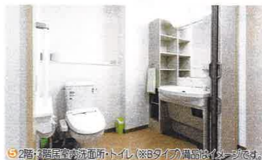
2階・3階居室内洗面所・トイレ(※Bタイプ)備品はイメージです。