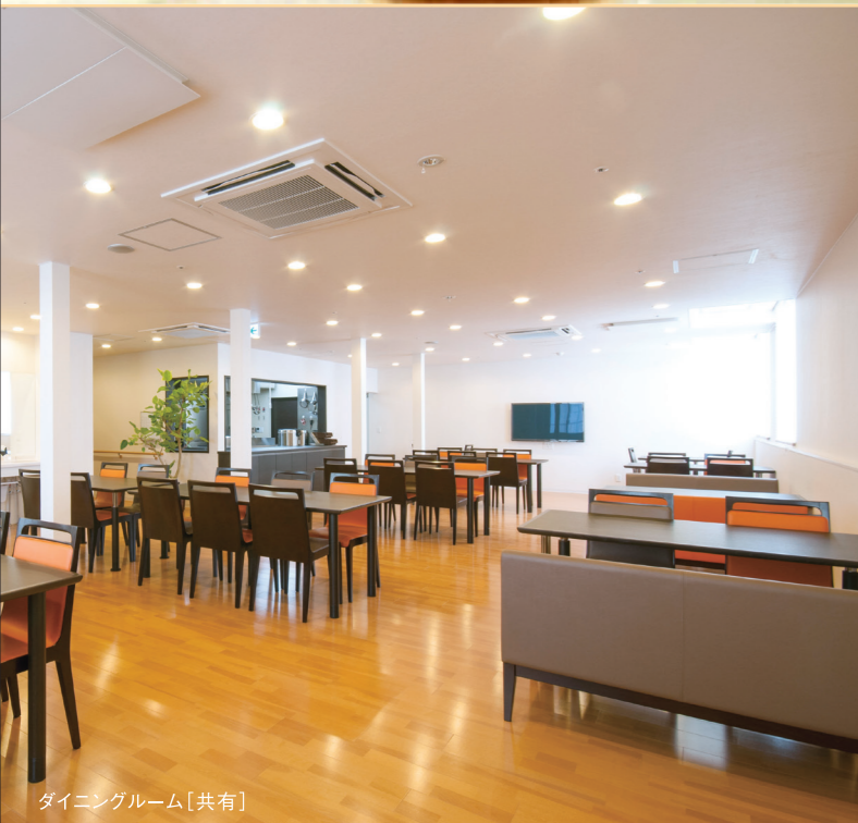
ダイニングルーム【共有】