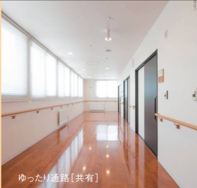
ゆったり通路【共有】